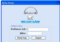
Program Açılış Ekranı