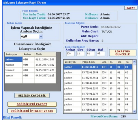
Program Lokasyon Kayıt Ekranı